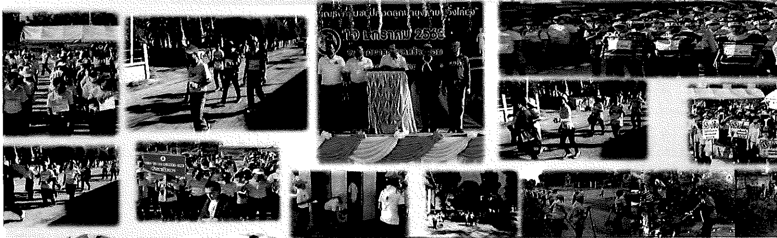
ผลสำรวจและกำจัดแหล่งเพาะพันธุ์ยุงลายในหมู่บ้าน

กลุ่มเป้าหมายเข้าร่วมกิจกรรม ประกอบด้วย เจ้าหน้าที่ อาสาสมัครสาธารณสุข นักเรียน และประชาชนในพื้นที่ทุกเป็น เข้าร่วมกิจกรรม "วิ่งไต่สูง" จำนวน 511 คน ผู้เข้าร่วมกิจกรรมสำรวจลูกน้ำยุงลาย จำนวน 672 คน